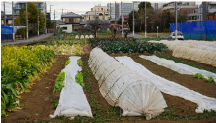
住宅地に囲まれたほ場